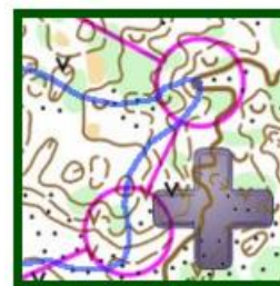
Add map with route